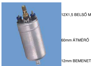
12X1,5 BELSŐ MENET 60mm ÁTMÉRŐ 12mm BEMENET