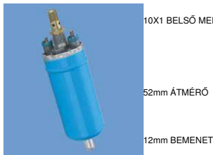
10X1 BELSŐ MENET 52mm ÁTMÉRŐ 12mm BEMENET