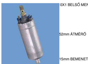
0X1 BELSŐ MENET 52mm ÁTMÉRŐ 15mm BEMENET