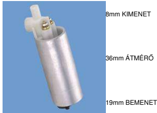
8mm KIMENET 36mm ÁTMÉRŐ 19mm BEMENET